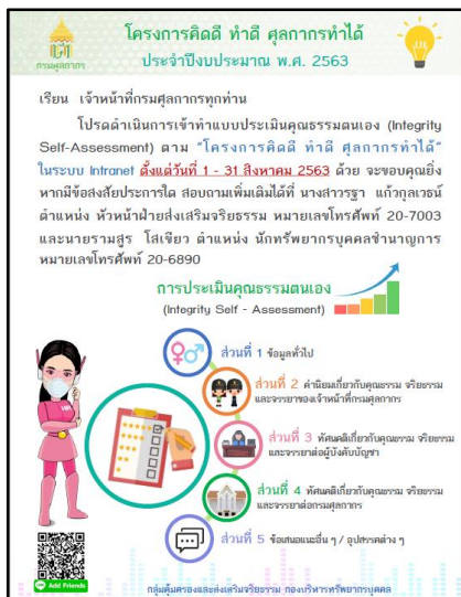
๔. โครงการคิดดี ทำดี สุกการทำได้