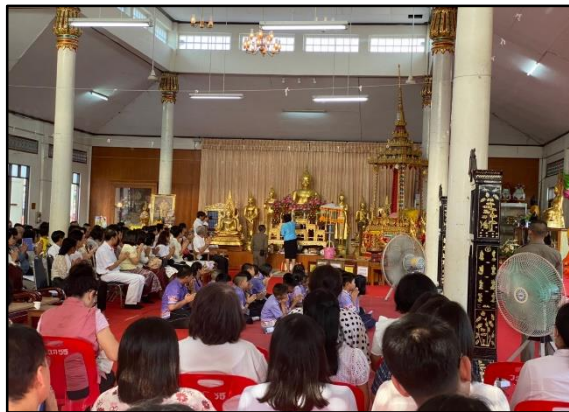
๓. โครงการเข้าวัดปฏิบัติธรรมวันธรรมสวนะ