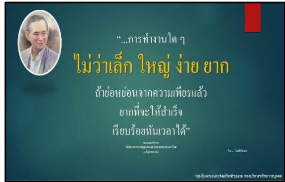
๒. โครงการพระบรมราชาบาท คติธรรม และคำสอน