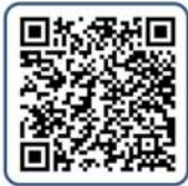
คู่มือการยื่นขอรับบำนาญผ่านระบบ Digital Pension

การขอรับบำนาญผ่านทางระบบบำนาญและสวัสดิการ รักษาพยาบาลของกรมบัญชีกลาง (Digital Pension)