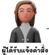
ผู้ได้รับแจ้งคำสั่ง